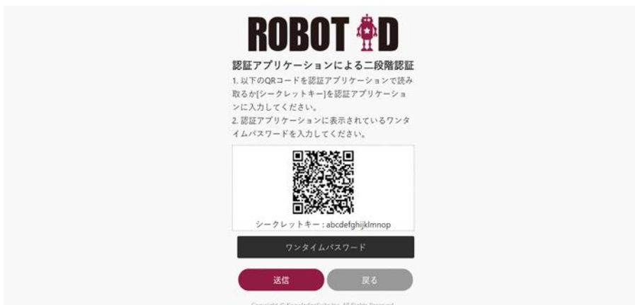
秘密鍵 QR コード表示画面